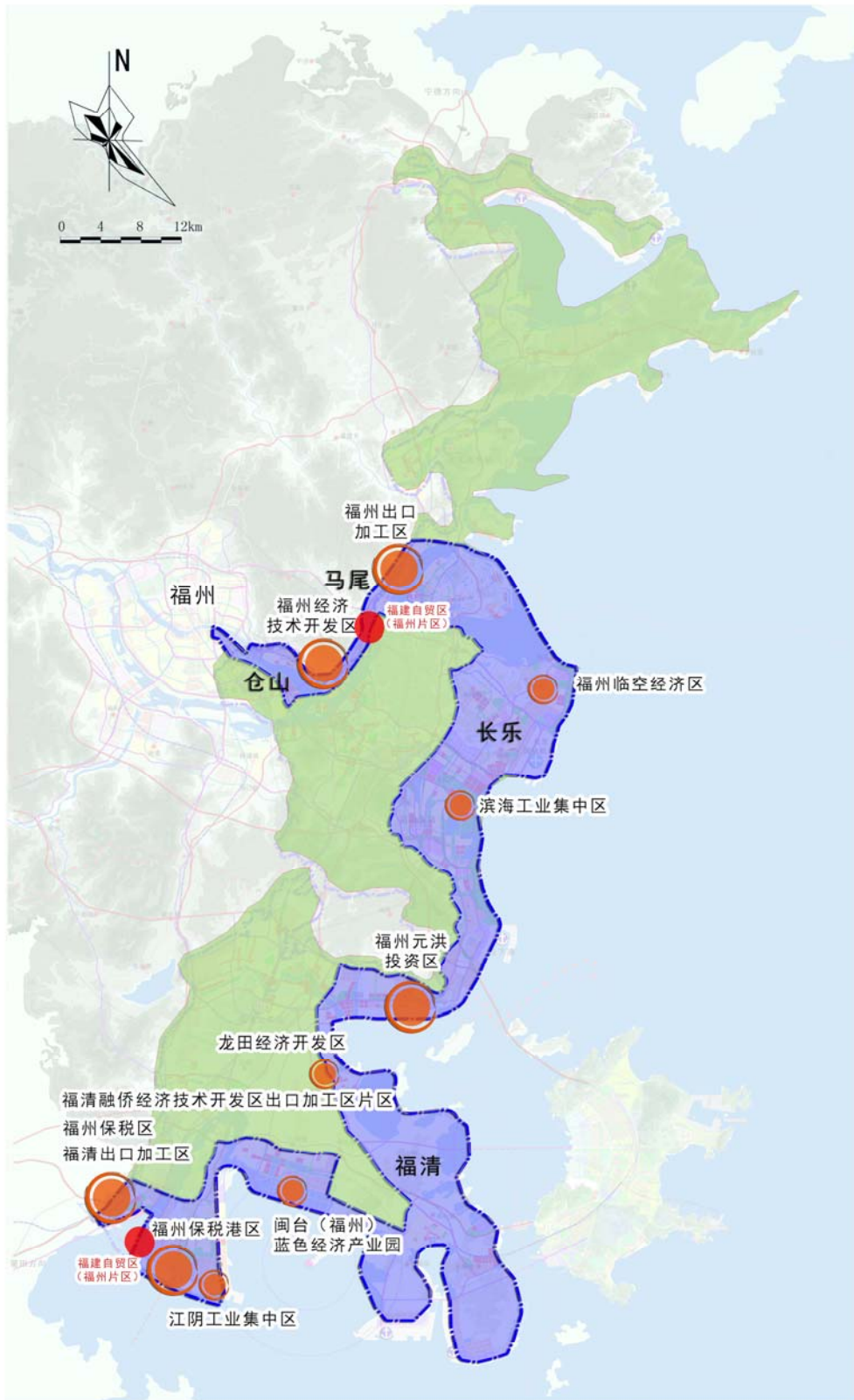
福州新区总体布局图