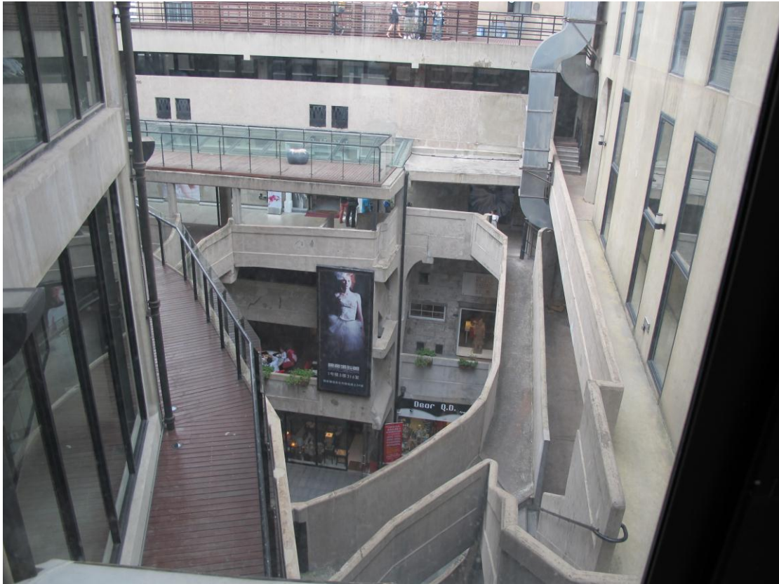
图 6 “1933 老场坊”内景照片 15

随着时代的演进，历史遗迹也开始承担多样的社会功能。对于遗产地的当代化应用有其时代必然性，但由此带来的原有遗产地所呈现的历史场景模糊也是不容回避的问题。在现代功能利用与传统历史氛围展示方面的平衡是该种利用方式所要解决的关键问题。而这一问题的解决仍需根据遗产的多样性而区别对待，并提出针对性的解决方法。