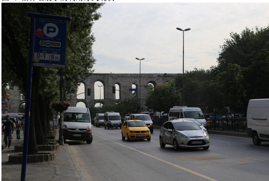
图 5 伊斯坦布尔市区乌赞克梅输水道穿越闹市区