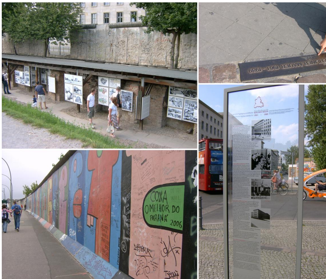
图 4 柏林墙展示及利用方式现状