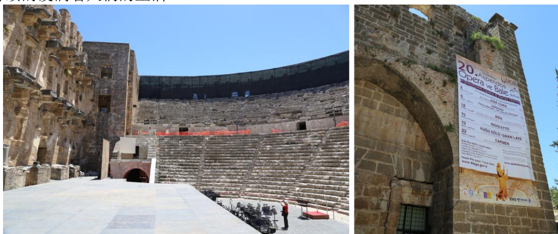
图 1 阿斯潘多斯剧场正在筹备文化活动

当文化遗产所承载的历史功能与当代所需社会功能取得部分一致时，遗产价值物质载体保存相对较完整的情况下即会采取这一模式，其中较为典型的案例即是阿斯潘多斯剧场(Aspendos Theater)与埃玛努埃尔二世拱廊(Galleria Vittorio Emanuele II)。位于土耳其潘菲利亚的阿斯潘多斯剧场以其完美的声学效果 7 至今仍然保持着旺盛的生命力，现今仍然是土耳其重要的文化展演空间，并定期举办国际音乐节等文化活动，如图 1 所示。同样，意大利米兰大教堂附近的埃玛努埃尔二世拱廊亦是从 1877 年建成至今仍然保持着旺盛生命力。拱廊内高级时装店铺林立，时尚氛围浓厚，被誉为“米兰的客厅” 8 ，作为米兰的时尚地标，这里一直以来都是当地人聚会的首选地，如图 2 所示。遗产的价值也随着时代发展持续的浸润着人们的生活。