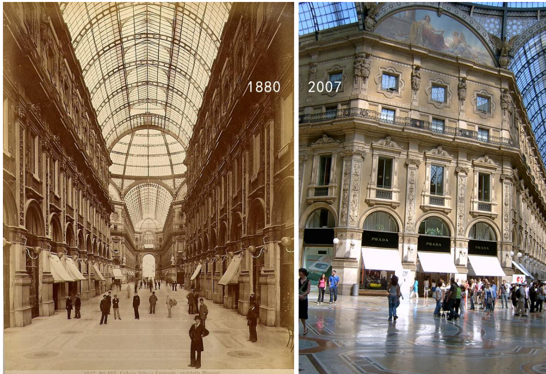
图 2 埃玛努埃尔二世拱廊 1880 年与 2007 年实景照片对比图 9